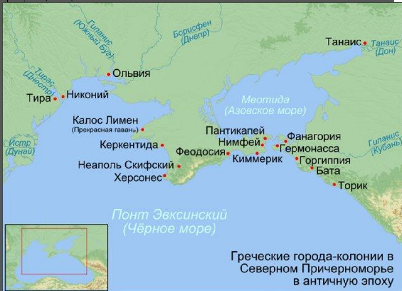
Карта "Грецькі міста на Чорному та Азовському морях".

У VII - кін. VI ст. до н.е. відбувається процес "великої грецької колонізації" у Північному Причорномор'ї, викликаний торговою експансією та відсутністю пристосованої для землеробства землі у Греції. Першим грецьким поселенням був о. Березань - Борисфеніда, у пер. пол. VI ст. до н.е. на правобережжі Бузького лиману постає Ольвія, на кін. V ст. до н.е. - Херсонес, Тіра, Феодосія у Криму, Пантікапей, Фанагорія. Основою грецького господарства Північного Причорномор'я були зерноробство, виноробство, рибальство і переробка риби, яка потім вивозилась до Греції. Високого рівня досягло ремесло - ткацтво, гончарство, обробка металів. Грецькі міста-держави були центрами торгівлі Північного Причорномор'я. З Греції надходила зброя, коштовності, посуд, солодоці, приправи, спеції.