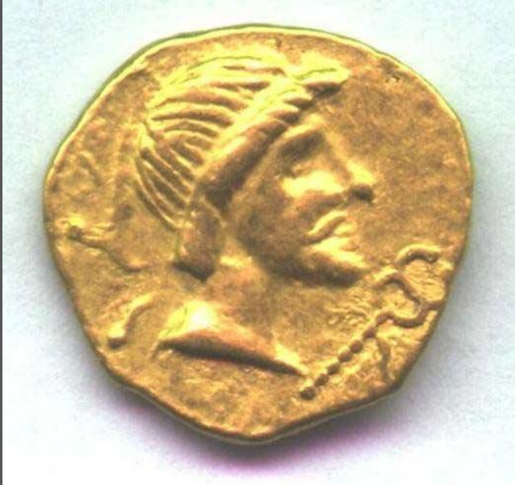
Монета скіфо-сарматського періоду.

неоднорідність. В кін. VI ст. до н.е. скіфи сформували державу, поділену на три частини, кожен з керівників якої був верховним царем. Панівне становище у країні належало царським скіфам, які вважали решту населення своїми рабами. Особливою пошаною у них користувалися бог вогню і стихії Табіті, боги неба і землі Апі та Пацай. Їхня віра у потойбічне життя зумовила складний поховальний звичай. І сьогодні скіфські кургани в українських степах постають символом колишньої могутності (фото пекторалі). Найбільшого розквіту Скіфія досягла у IV ст. до н.е. за царя Атея (від Дунаю до Дону). Держава стала централізованою, було започатковано карбування скіфської монети.